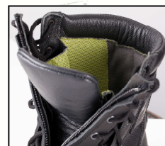
Doublure Dermody Coolmax